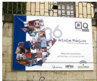
Museo Provincial de Jaén